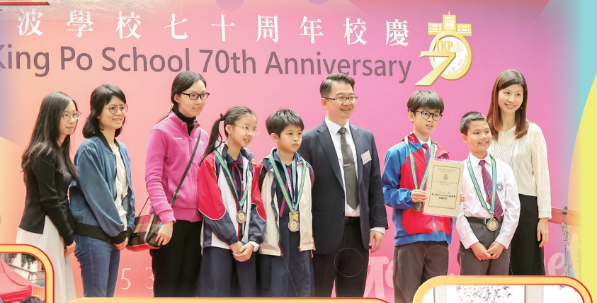
鄧鏡波學校七十周年校慶 Tang King Po School 70th Anniversary