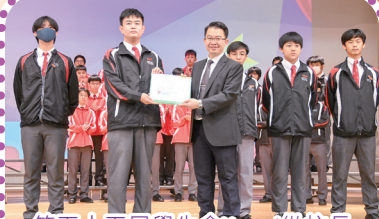
第五十五屆學生會Yesod從校長手上接過學生會文件夾

第五十五屆學生會Yesod於11月10日(星期五)的就職典禮上走馬上任。在台上，學生會所有幹事在眾師生面前宣誓，承諾於來年貫徹鮑思高神父之慈愛精神，履行鄧鏡波學校之校訓「立己立人」，謙下服務，建立一個更美好的校園，以答謝同學們的支持。