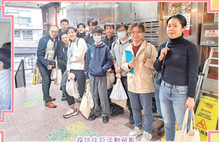
探訪住戶活動留影