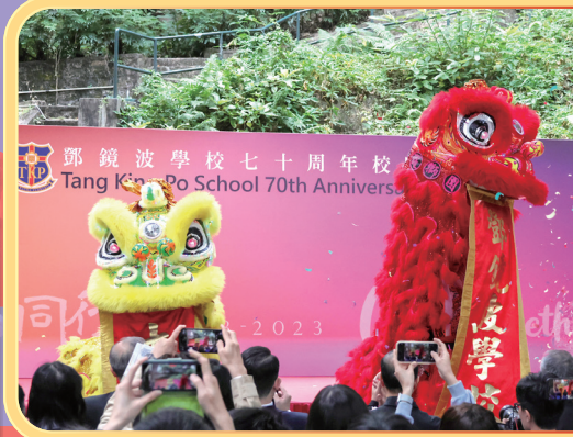
鄧鏡波學校七十周年校慶 Tang King Po School 70th Anniversary