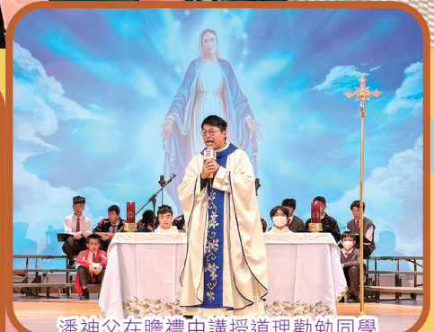
潘神父在瞻禮中講授道理勸勉同學