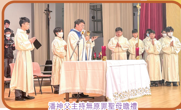
潘神父主持無原罪聖母瞻禮