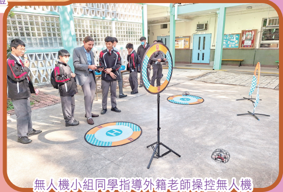
無人機小組同學指導外籍老師操控無人機