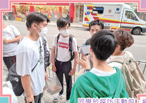
同學於探訪活動前，細心聆聽負責社工的解說