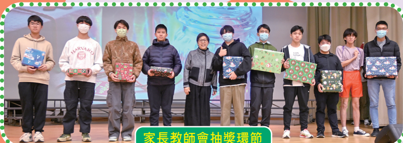
家長教師會抽獎環節

2023年度聖誕聯歡會於12月20日(星期三)在本校禮堂舉行。當天節目琳瑯滿目，為節日添上不少歡樂色彩。