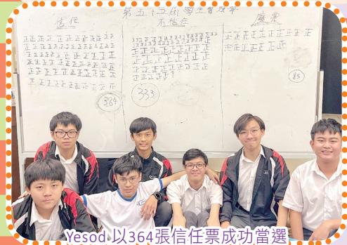
Yesod以364張信任票成功當選

學生會選舉投票日及點票於10月16日(星期一)順利舉行。經統計後，Yesod獲得過半數信任票成功當選。學生會感謝各方協助，使選舉及點票井然有序地進行。