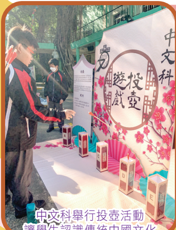
中文科舉行投壺活動 讓學生認識傳統中國文化