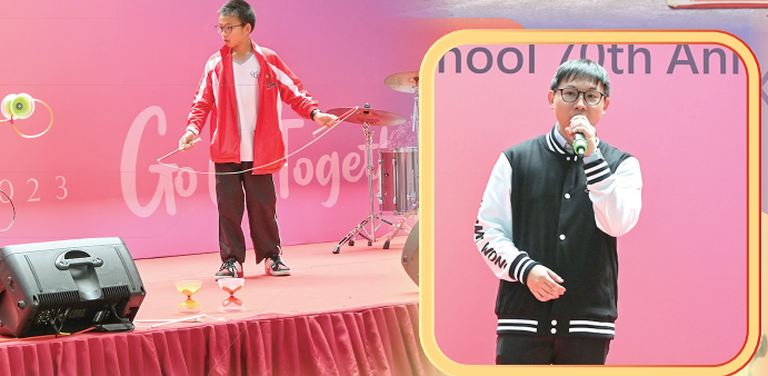
23 Go Together!