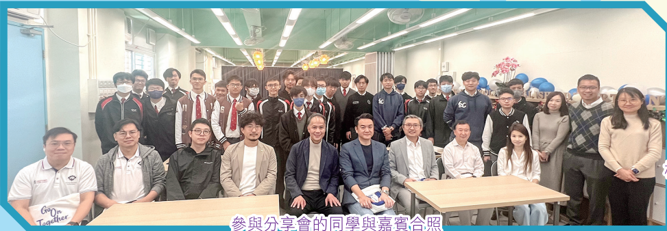
參與分享會的同學與嘉賓合照