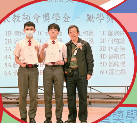
莫福金先生頒發獎項