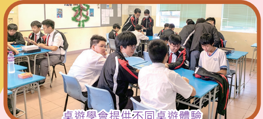
桌遊學會提供不同桌遊體驗