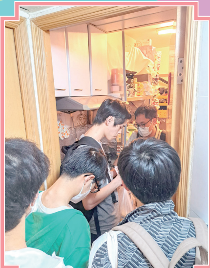
同學從不同角度瞭解住戶的實際需要。

本校健康管理與社會關懷科中六級同學於2023年12月13及19日，分別到元朗區及葵涌區探訪低收入人士。是次探訪的目的除了讓同學親身瞭解本港低下階層的生活情況，還讓同學把本科課堂上所學的知識及理論應用於分析社會議題上。