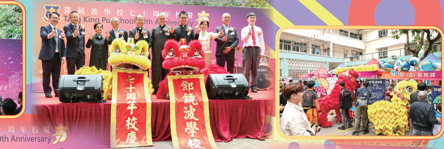
周年校慶 70th Anniversary