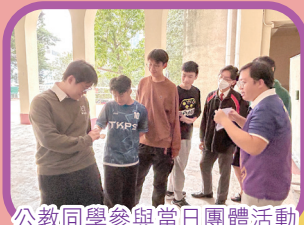
公教同學參與當日團體活動