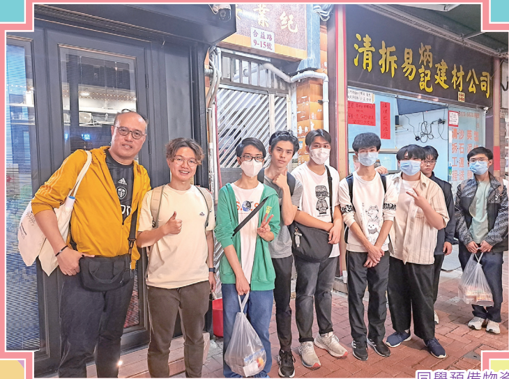
同學預備物資，贈予住戶