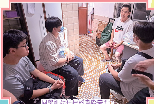
同學細聽住戶的實際需要。