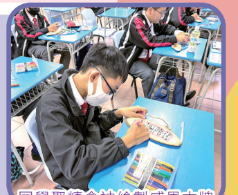
同學聚精會神繪製感恩木牌