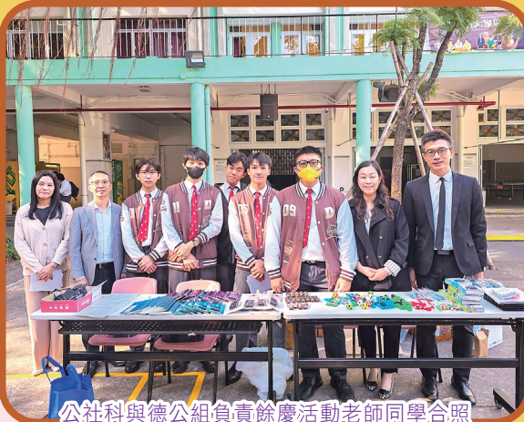
公社科與德公組負責餘慶活動老師同學合照