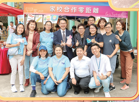
家合作零距離 Go O. Together!