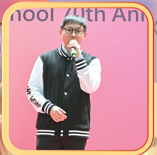
鄧鏡波學校七十周年校慶 Tang King Po School 70th Anniversary