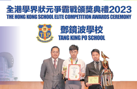
鄧鏡波學校 榮獲 狀元學府大獎 及 狀元之師大獎

同時，本校亦獲得大會頒發的以下獎項： 狀元學府大獎 狀元之師大獎 傑出精英培育推動大獎