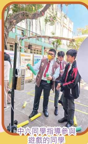
中六同學指導參與 遊戲的同學