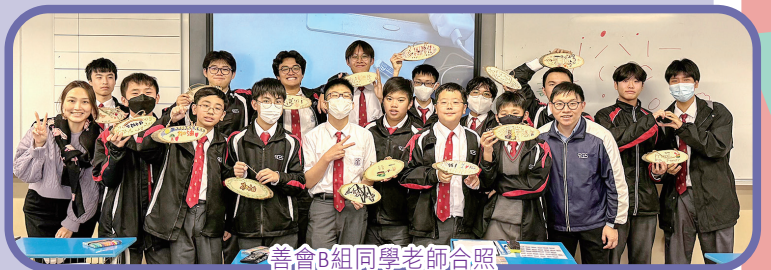
善會B組同學老師合照