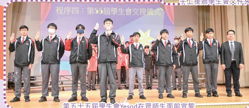
程序四：第55屆學生會交接儀式