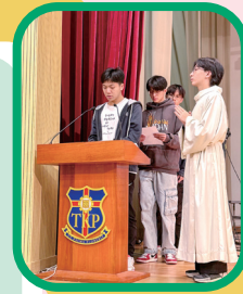
公教同學宣讀信友禱文