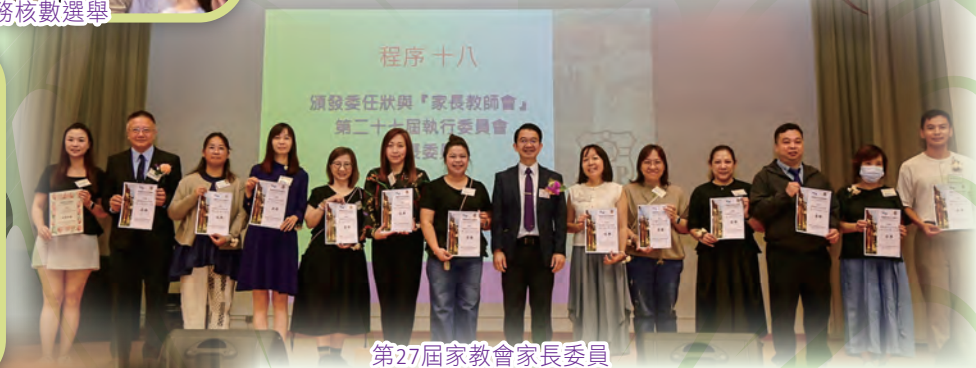
第27屆家教會家長委員