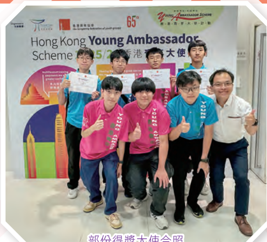
部份得獎大使合照