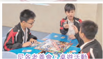
尼各老善會，桌遊活動