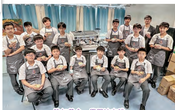
路加善會，學習沖咖啡