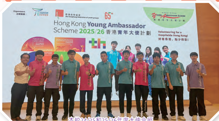
本校24/25和25/26年度大使合照

25/26年度將有5位同學繼續參與上述活動，期望同學們能夠從不同角度，學習和感受香港旅遊業。