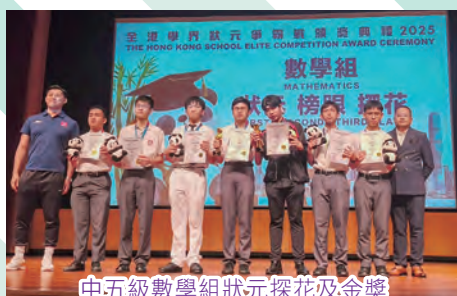
中五級數學組狀元探花及金獎