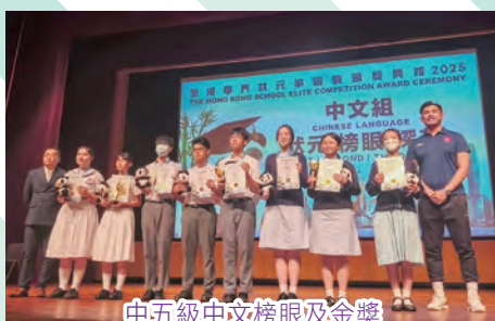
中五級中文榜眼及金獎