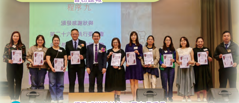
頒發感謝狀給第26屆家長委員