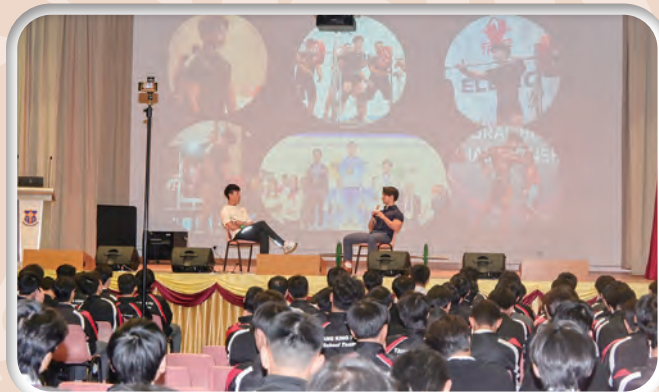
中四至中六生命教育課： 與全國健力紀錄保持者對話