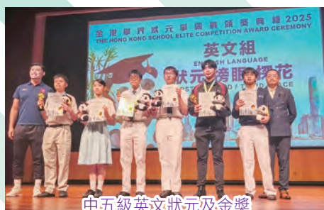
中五級英文狀元及金獎