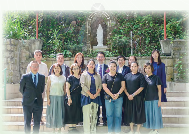
第二十七屆執行委員會委員