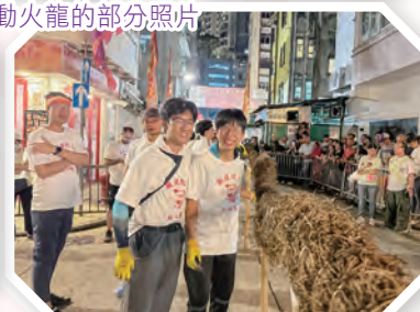
在大坑舞動火龍的部分照片