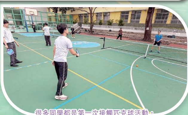
很多同學都是第一次接觸匹克球活動，大家都很投入，聽從教練悉心教導