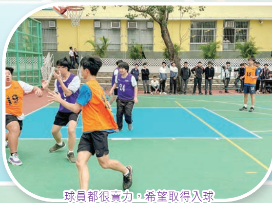
球員都很賣力，希望取得入球