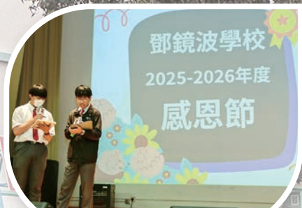
兩位司儀為本學年的感恩節揭開序幕