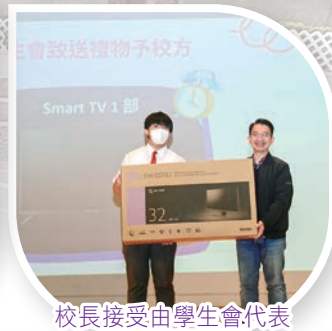
校長接受由學生會代表致送校方的禮物