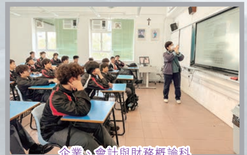
企業、會計與財務概論科