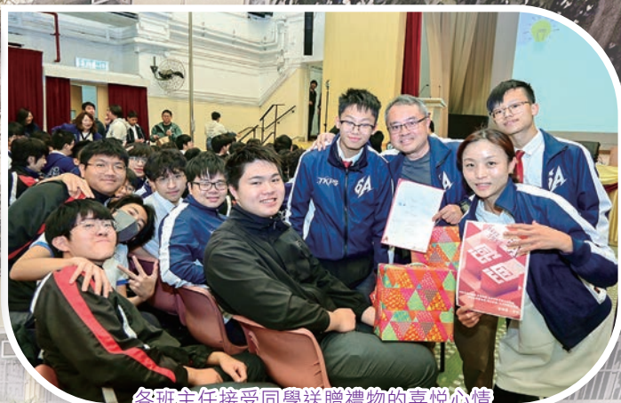
各班主任接受同學送贈禮物的喜悅心情