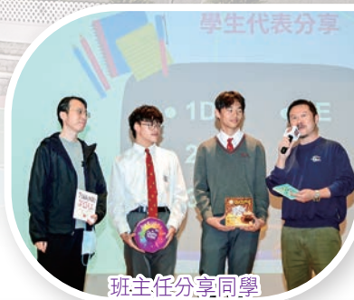
班主任分享同學精心挑選的禮物的感受