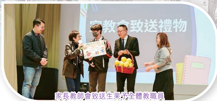
家長教師會致送生果子全體教職員