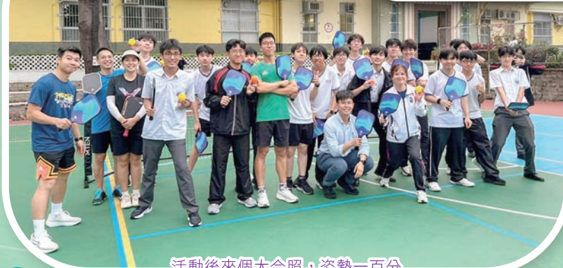
活動後來個大合照，姿勢一百分