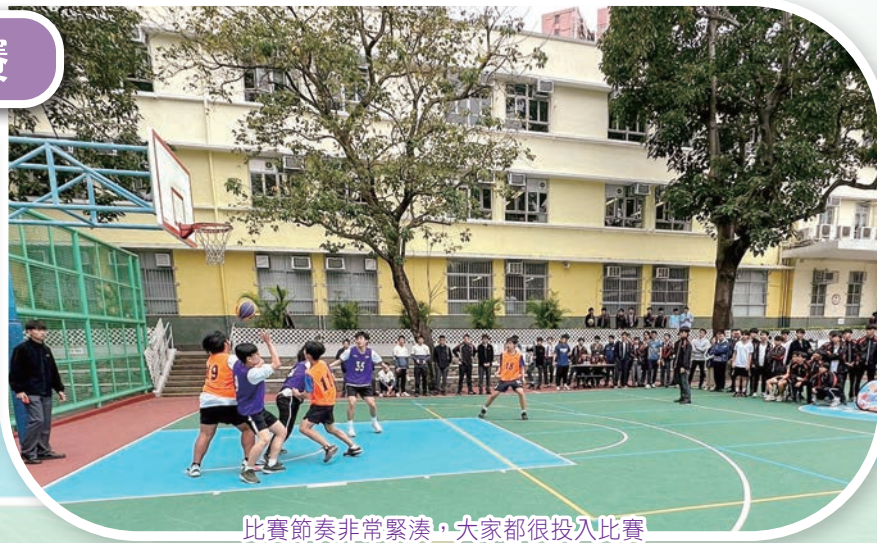
比賽節奏非常緊湊，大家都很投入比賽