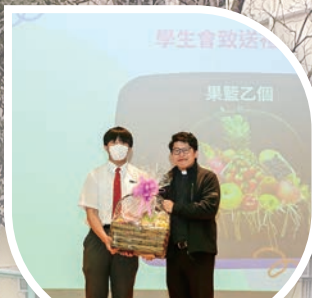
學生會主席致送健康果籃予神長們